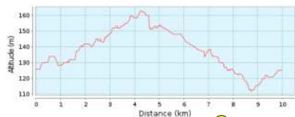
Höhenprofil (112m bis 163m), ● 1. Runde

G = Getränkeausgabe (für Läufer) W = Wechselzonen (W1, W2, W3)